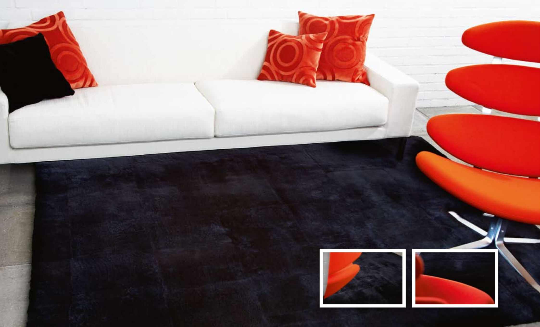
| Design Rug Shortwool Black